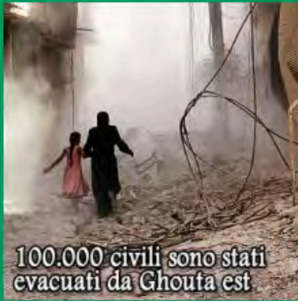
100.000 civili sono stati evacuati da Ghouta est

Perché l'aviazione della NATO si sposta in Giordania?