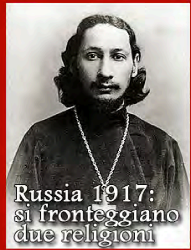
Russia 1917: si fronteggiano due religioni