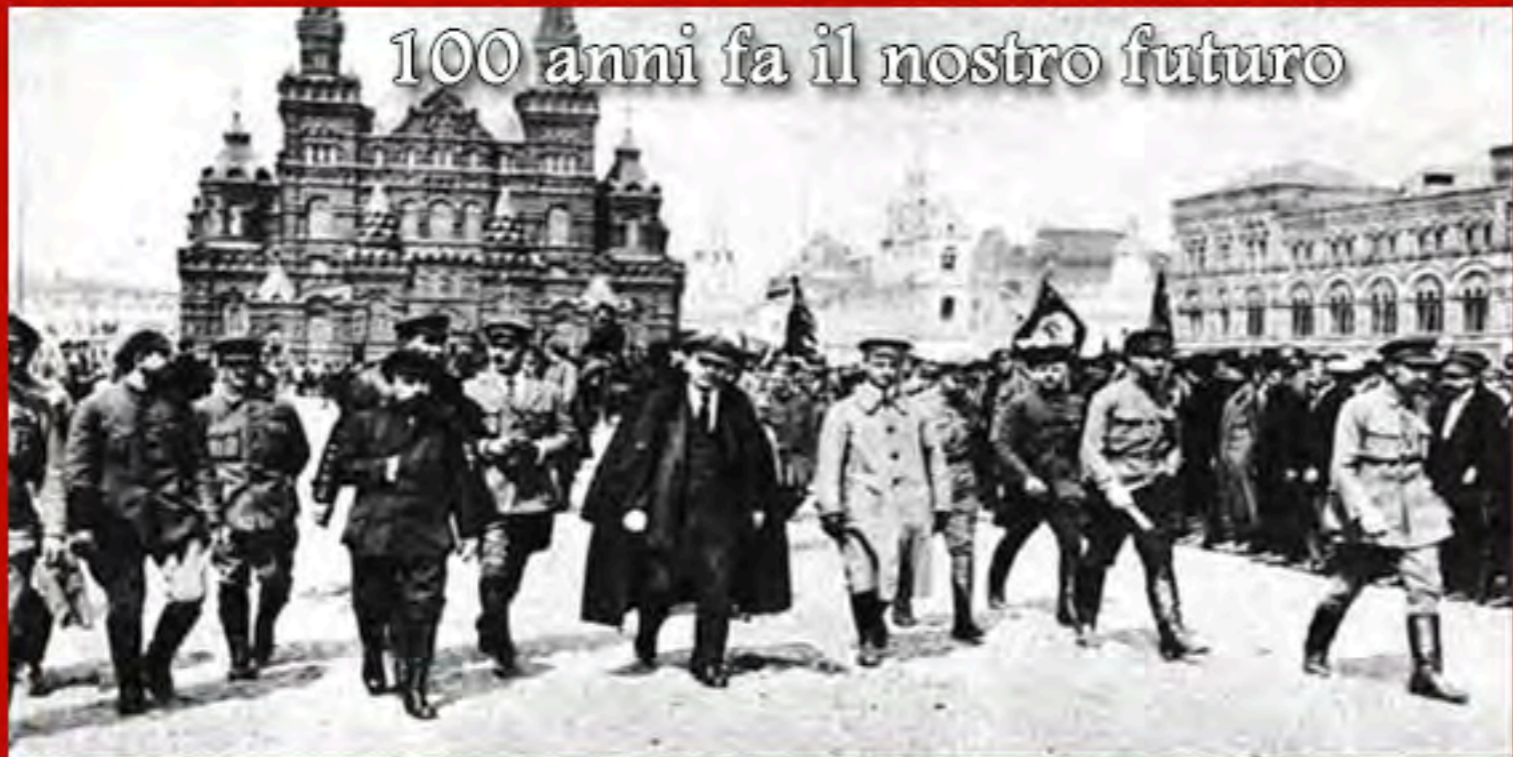
100 anni fa il nostro futuro