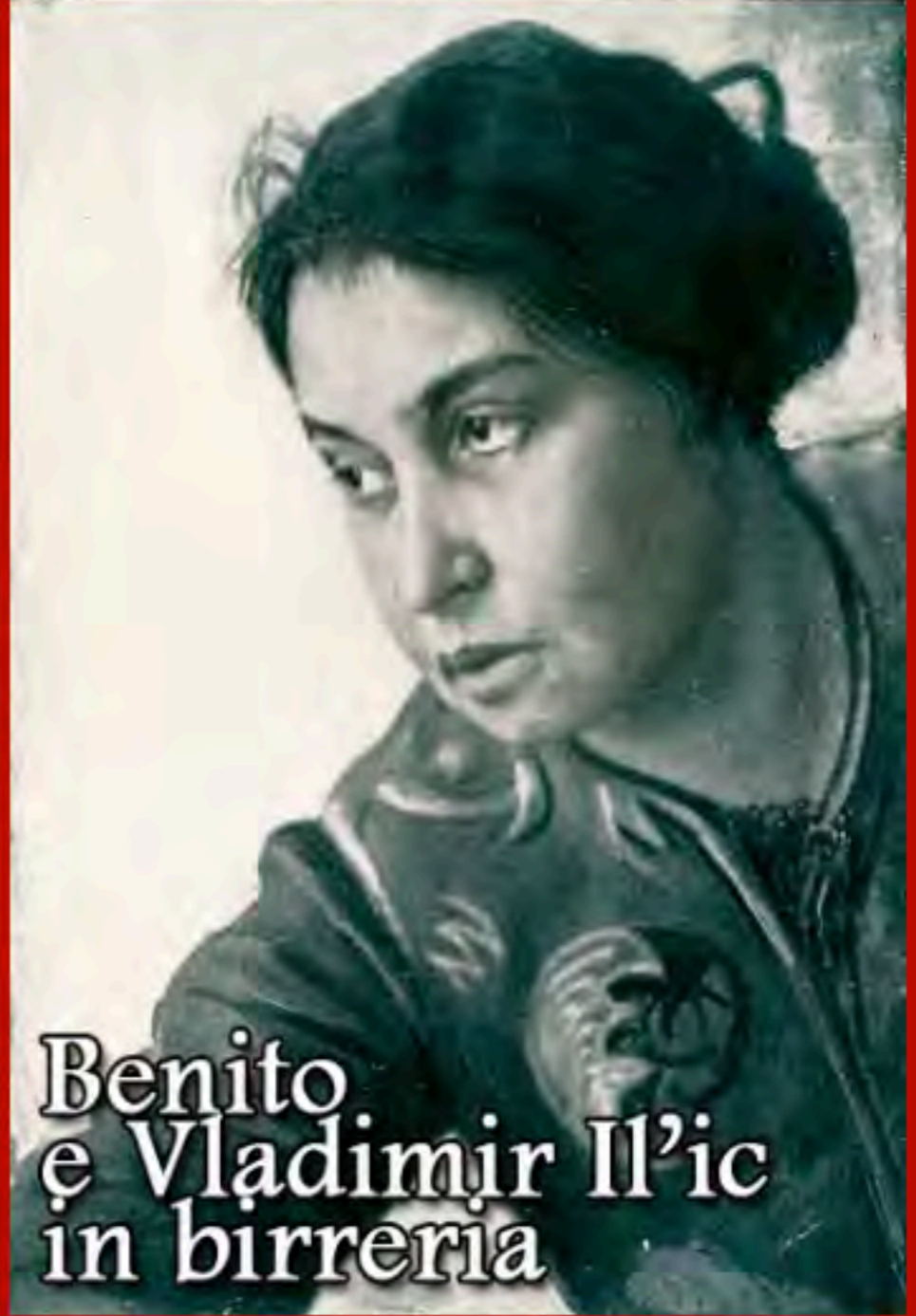
Benito e Vladimir Il'ic in birreria

Nella mia giovinezza sono diventata comunista innanzitutto perché le persone care e buone che conoscevo lo erano. Cosicché io, già consapevole di una certa accidentalità del giudizio umano, pregavo il buon Gesù di farmi diventare da grande comunista e non fascista.