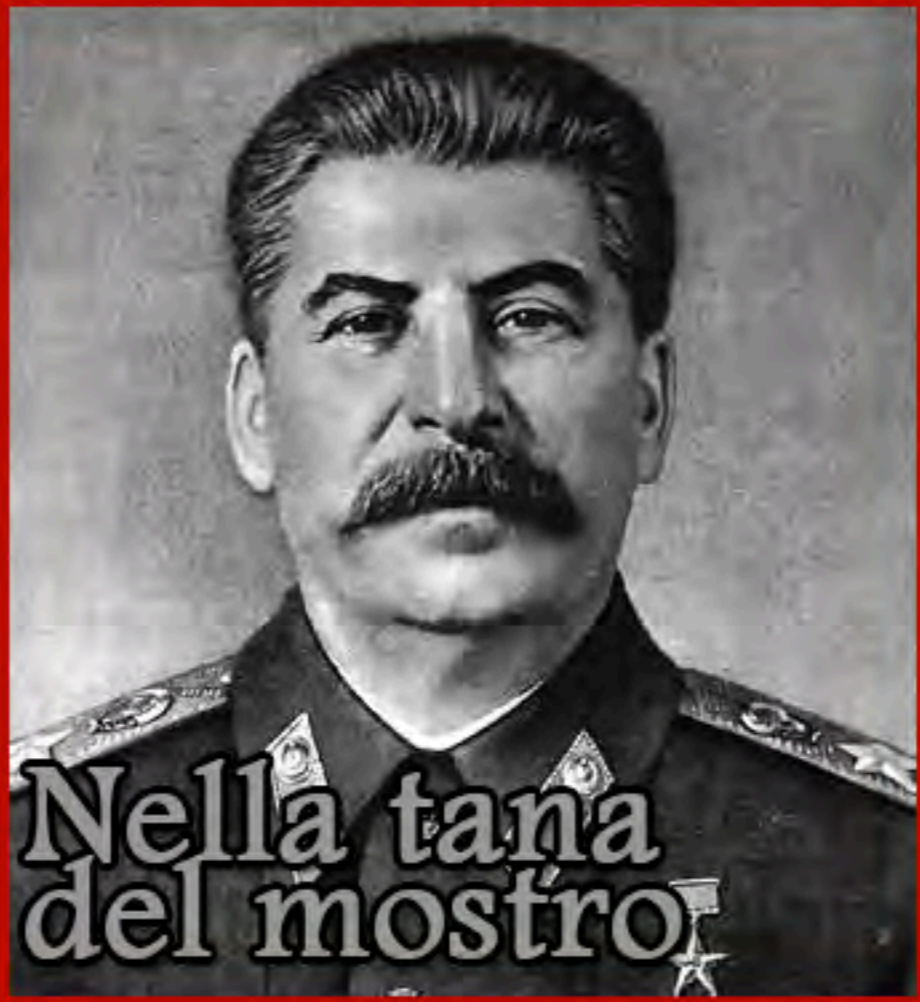
Nella tana del mostro