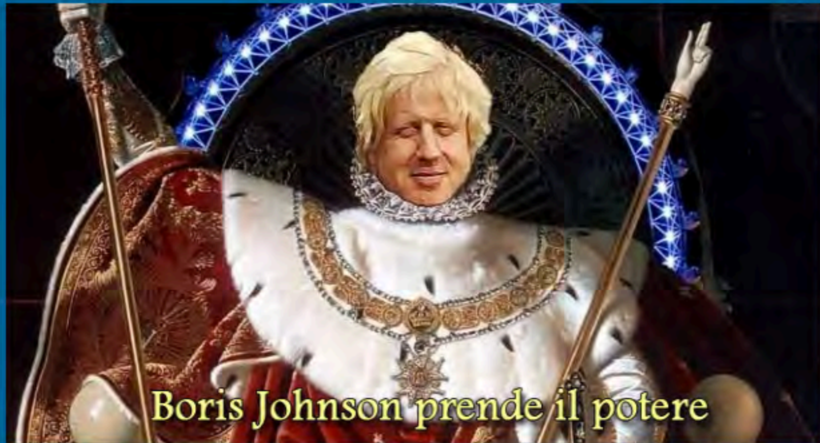
Boris Johnson prende il potere