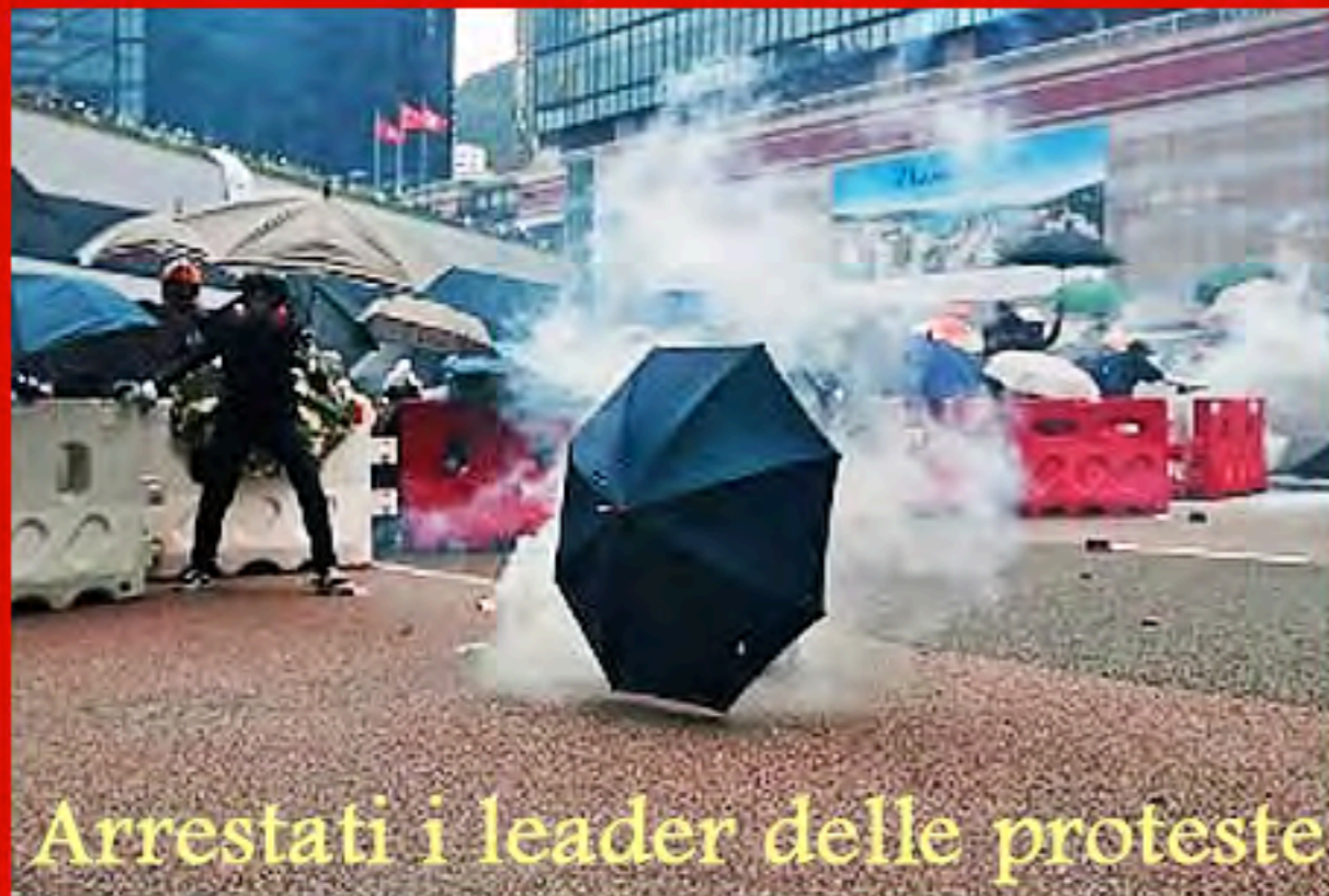
Arrestati i leader delle proteste