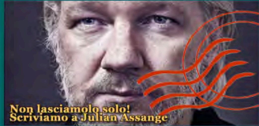
Non lasciamolo solo! Scriviamo a Julian Assange