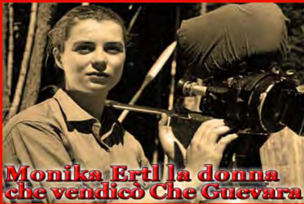
Monika Ertl la donna che vendicò Che Guevara