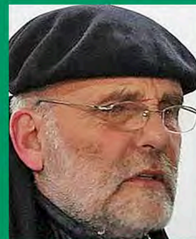
Parolin, speriamo conferma su Dall'Oglio