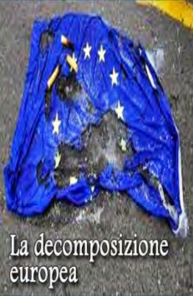
La decomposizione europea

Rompere con il gioco dei trattati europei che impongono l'austerità