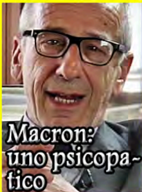
Macron: uno psicopatico

Risposta di Potere al Popolo! a Jean Luc Mélenchon