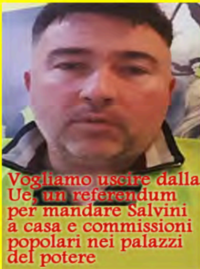
Vogliamo uscire dalla Ue, un referendum per mandare Salvini a casa e commissioni popolari nei palazzi del potere