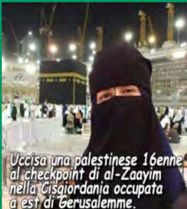
Uccisa una palestinese 16enne al checkpoint di al-Zaayim nella Cisgiordania occupata a est di Gerusalemme.

MADA condanna gli attacchi contro giornalisti in Cisgiordania e Gaza