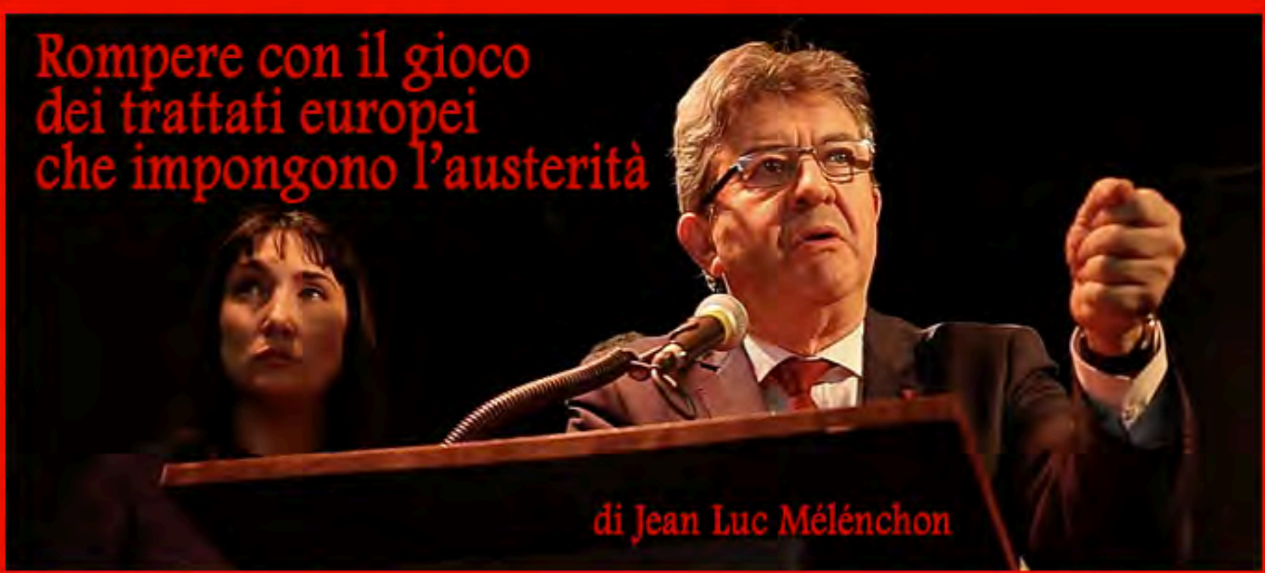
di Jean Luc Mélenchon

Rompere con il gioco dei trattati europei che impongono l'austerità