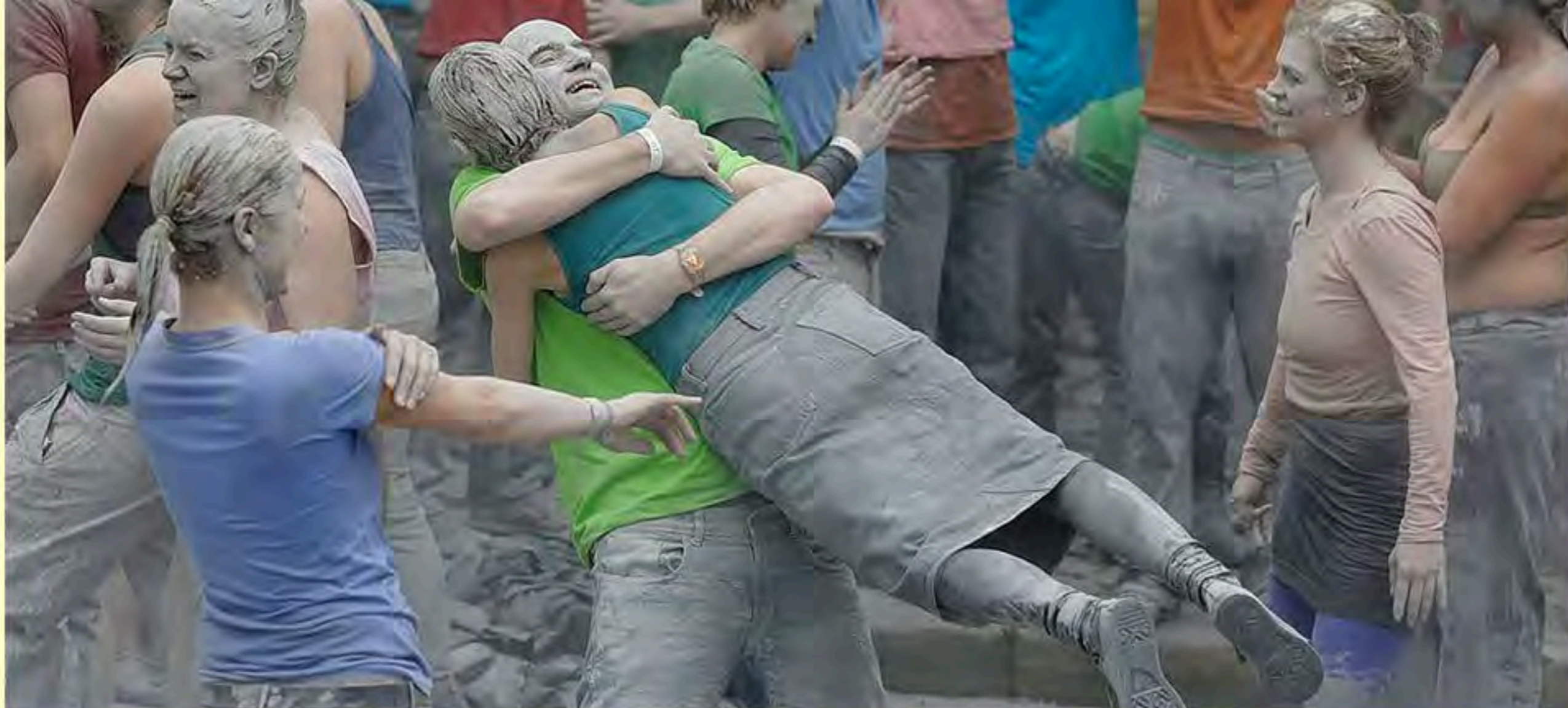
Amburgo, manifestanti come zombie: protesta in piazza prima del G20