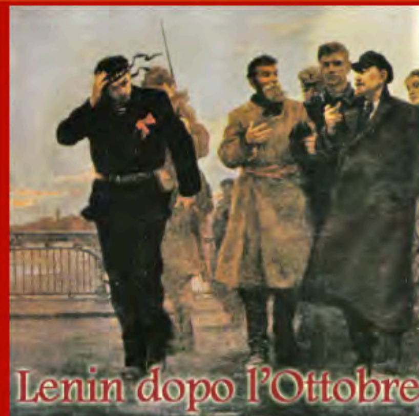
Lenin dopo l'Ottobre