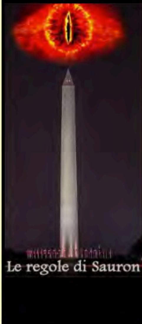
Le regole di Sauron