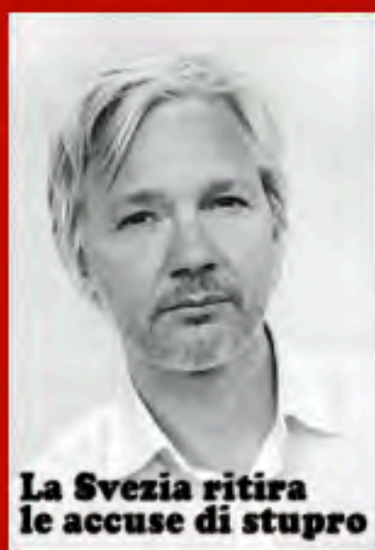
La Svezia ritira le accuse di stupro