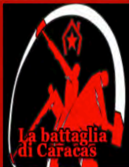
La battaglia di Caracas