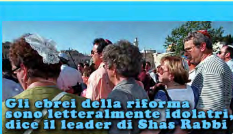
Gli ebrei della riforma sono letteralmente idolatri, dice il leader di Shas Rabbi