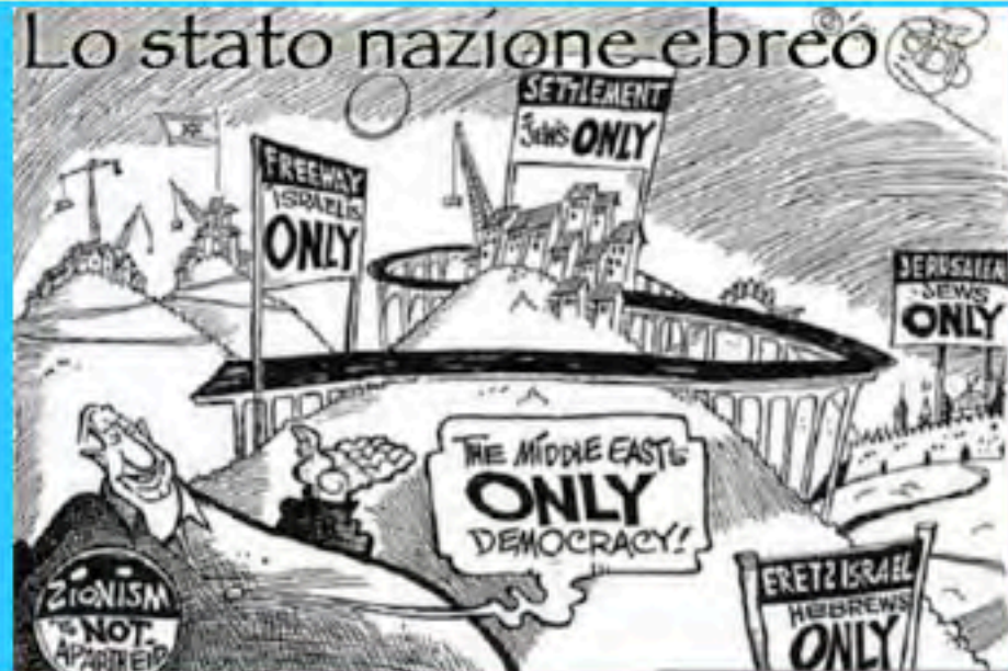
Lo stato nazione ebreo