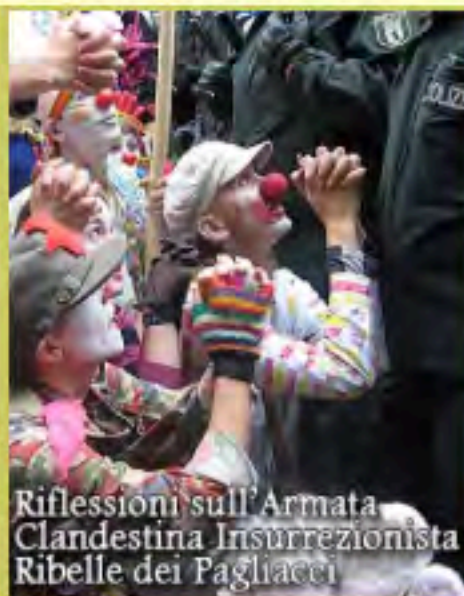
Riflessioni sull'Armata Clandestina Insurrezionista Ribelle dei Pagliacci