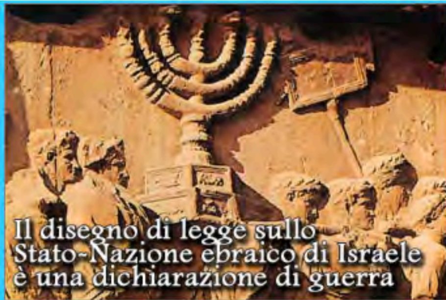
Il disegno di legge sullo Stato-Nazione ebraico di Israele è una dichiarazione di guerra