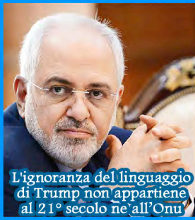
L'ignoranza del linguaggio di Trump non appartiene al 21° secolo ne' all'Onu

Per la prima volta in 72 anni, un capo di stato intervenuto all'Assemblea Generale delle Nazioni Unite ha minacciato di distruggere un intero paese e i suoi abitanti.