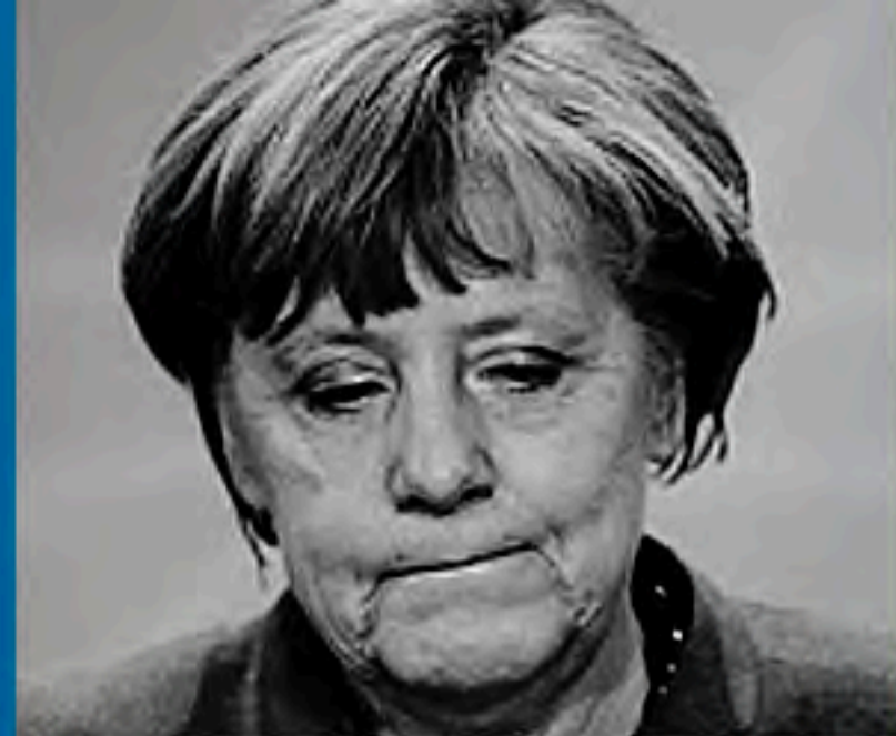
Il modello a cui s'ispira Emmanuel Macron