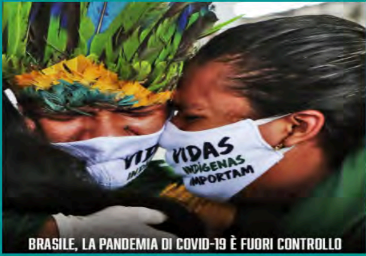
BRASILE, LA PANDEMIA DI COVID-19 È FUORI CONTROLLO