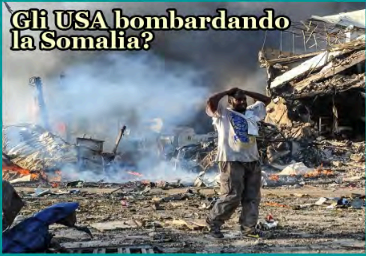
Gli USA bombardando la Somalia?