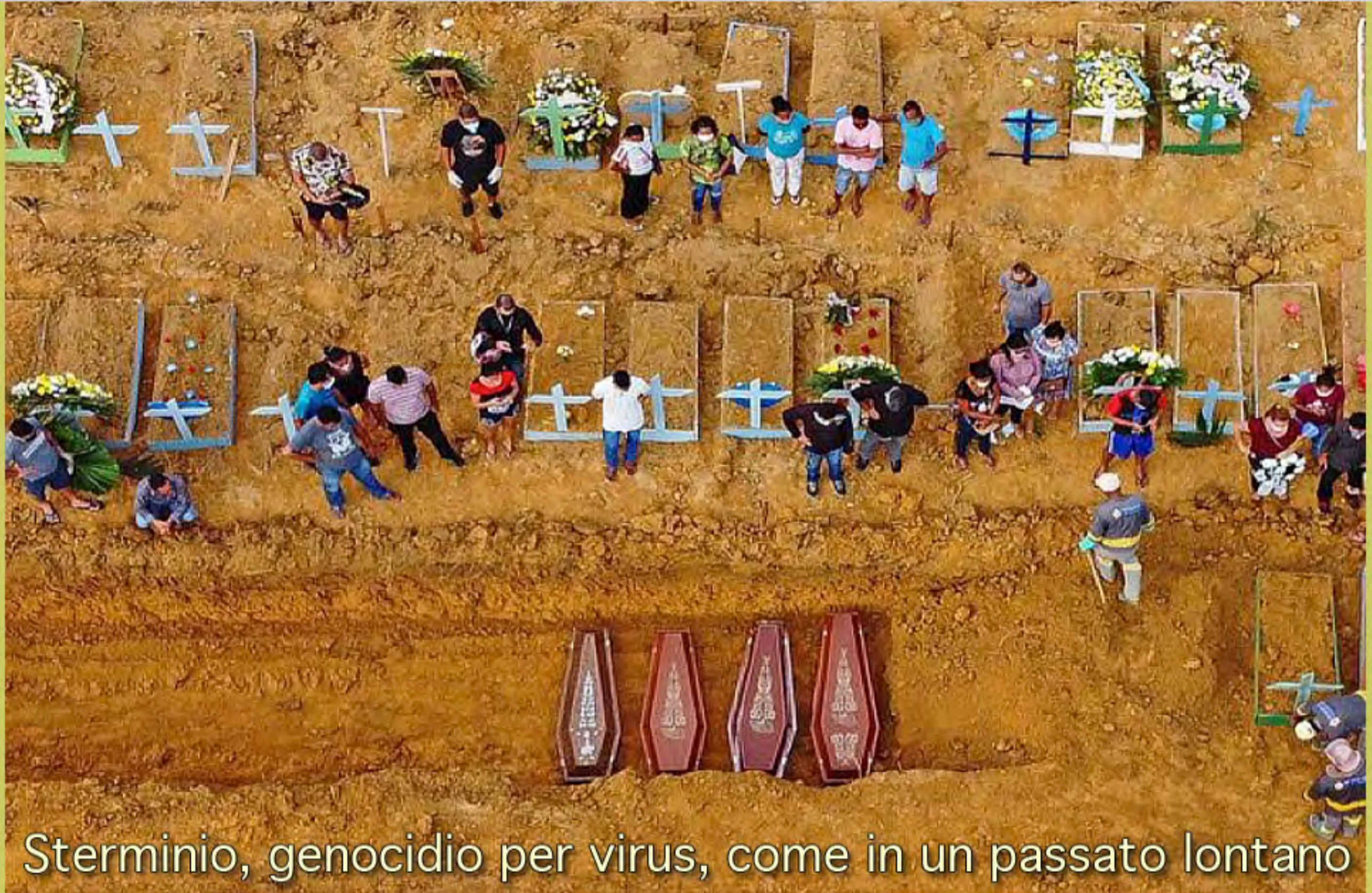
Sterminio, genocidio per virus, come in un passato lontano