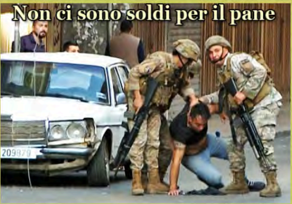
Non ci sono soldi per il pane