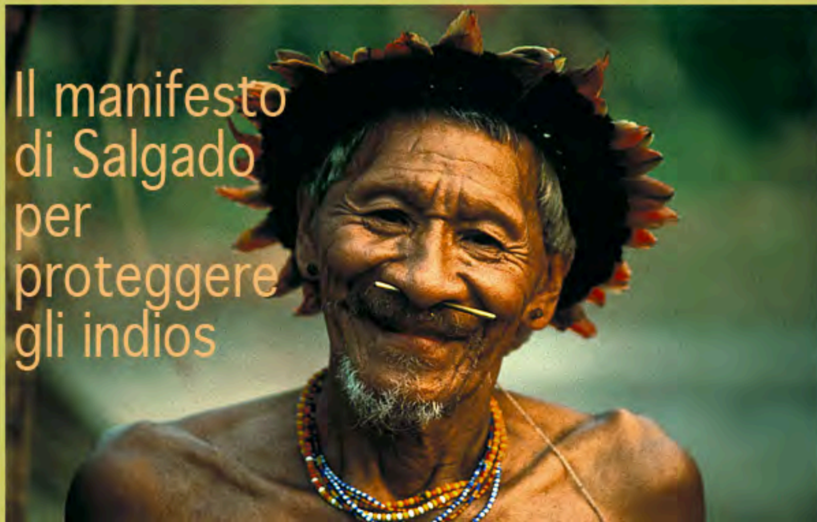
Il manifesto di Salgado per proteggere gli indios